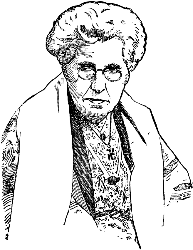
डॉ. अनी बेझंट